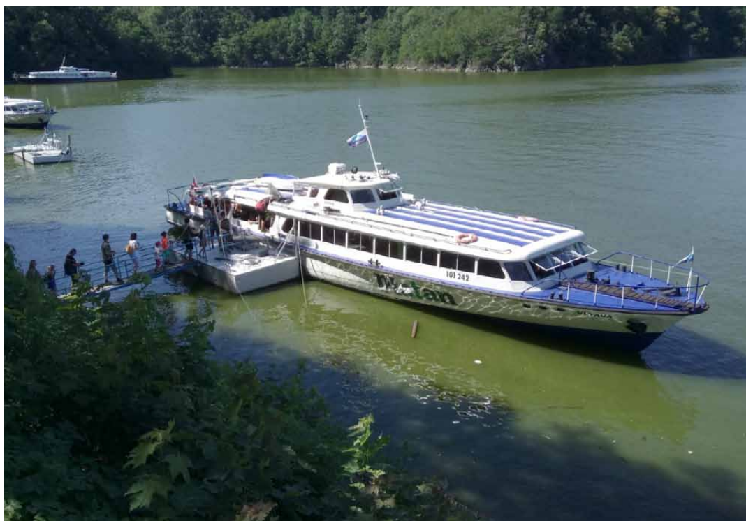
Vlajková loď platanské flotily.

Američané mají svoji flotilu letadlových lodí, které tvoří páteř jejich vojenské moci. Vedle USA je na světě jen pár mocností, které také mají svoji letadlovou loď, ale pozadu není ani pivovar Platan.