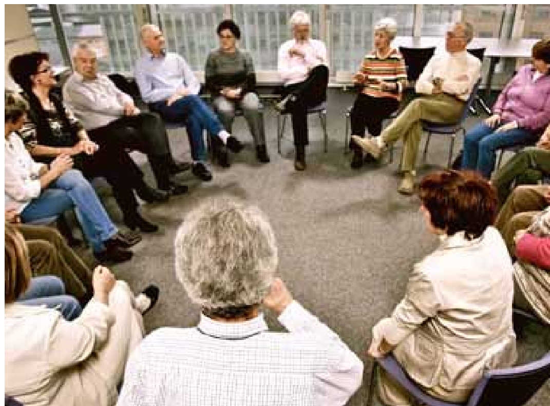
Alkoholici kulatého klubu.

Věděli jste, že Anonymní alkoholici jsou oficiální instituce? Překvapilo to i nás, a proto jsme se rozhodli udělat v dnešním čísle takříkajíc osvětu a v rychlosti vás seznámit s tímto spolkem.