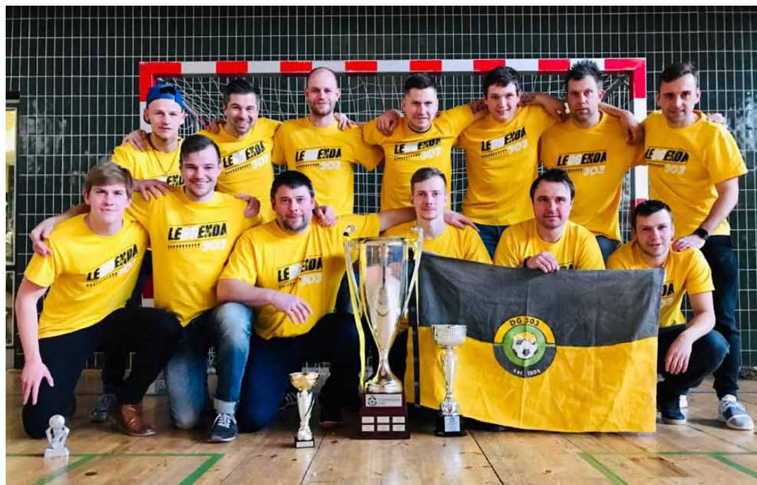
DG303; vítěz Vodňanské ligy 2019/2020 a také vítěz STATOM základní části.

Vodňanská liga uzavřela v sobotu 15 února 2020 už svou 26. sezónu. Již sedmým vítězstvím v řadě ji ovládli hráči DG303, kteří měli tradičně dokopnou u nás v hospodě.