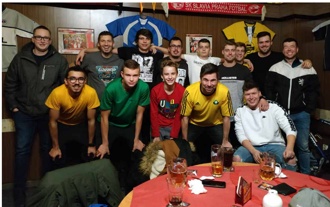
Kompletní sestava účastníků turnaje FIFA20

Ve čtvrtek 26. prosince proběhl v restauraci Pod Věží premiérový turnaj ve hře FIFA20 pod hlavičkou Vodňanské ligy.