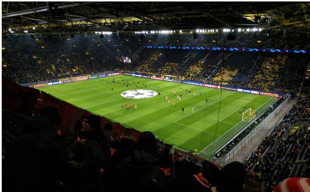
Pohled ze slávistického kotle na stadionu Borussia Dortmund.

Slavia Praha si letos zahrála základní skupinu Ligy mistrů. A nebyla to supina ledajaká; soupeřem sešíváných byla FC Barcelona, Inter Milán a Borussia Dortmund. A právě na hřišti posledně jmenovaného odehráli slávisté svůj poslední zápas v letošním