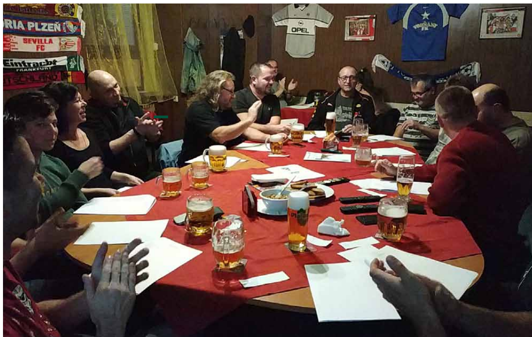
Nejlepší vodňanští pěvci v akci

Člověk by snad nesměl mít doma televizi, aby na něj z některého z komečnických kanálů nevyskočila nějaká ta talentová soutěž, ve které se hledá hlas nebo právě talent. Pod Věží našťestí žádnou takovou šarádu řešit nemusíme. My totiž náš hlas máme!