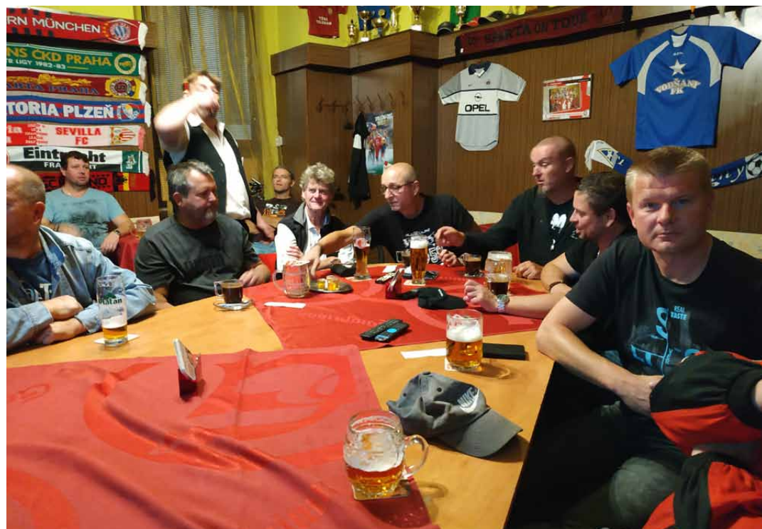
Osazenstvo salónku leckdy svede i odolného číšníka

O tom, že u nás v salónku (ale samozřejmě nejen tam, vlastně v celé hospodě včetně prostorů takřkajíc „za oponou“) se schází ti nejlepší z nejlepších návštěvníků vodňanských hospod nemusíme polemizovat. Je však ažs ne-