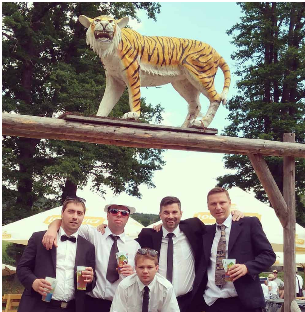
Gentleman U Tygra

Pod Věží měla znovu základnu také tradiční expedice na Vltavu. Pánové to tentokrát vzali trochu na úrovni a vyrazili si v oblecích.