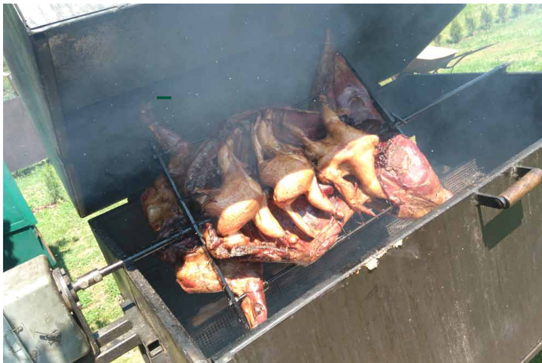
Daněk se točil a rožnil...

Léto tradičně patří nej-různějším venkovním akcím a grilování. Proto vám dnes přinášíme malé kuchařské okénko, nad kterým by zaslíntal i slovatný Zdeněk Pohlreich.