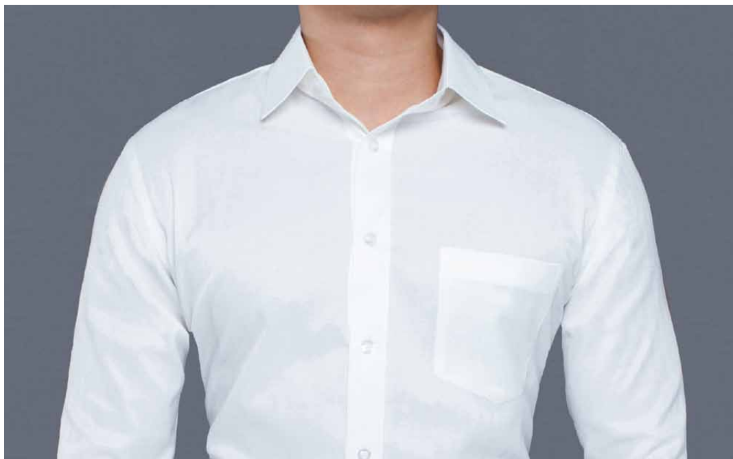
Toto je bílá košile

Zdá se nám, že kolem pingpongového stolu jaksi upadá kultura nebo přinejmenším lehce úpí sportovní estetika. Ať už vlivem toho, že někteří hráči hrají pod vlivem, nebo kvůli tomu, že lehkomyšlně podceňují vlastní outfit.