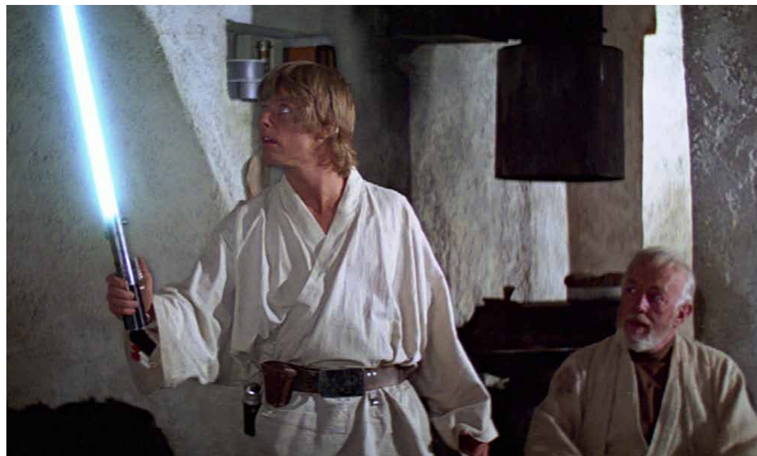
Světelný meč (v originále Lightsaber , takže vlastně světelná šavle)

Díky našemu kontaktu uvnitř policejního sboru České republiky jsme byli zavčasu upozorněni na to, že Policie ČR začne v nejbližší době rozšiřovat svůj zbrojní arzenál.