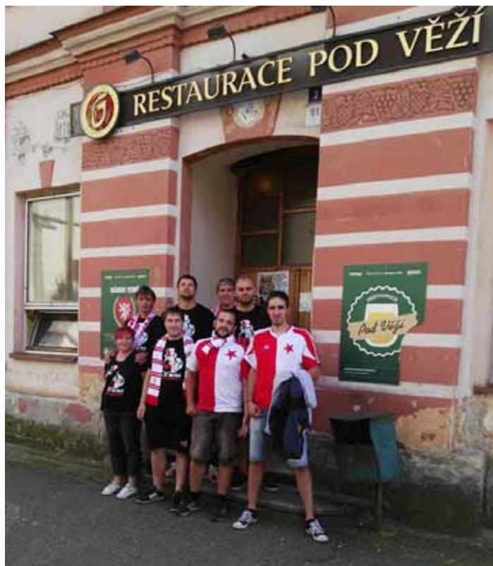
Sešívání eskadra před odjezdem na zápas...

Po návratu ze zápasu s Tallinem nechyběla tradiční dohra, kterou bývá dodatečná analýza předvedené hry i výkonů nad zlatavým mokem u nás na základě.