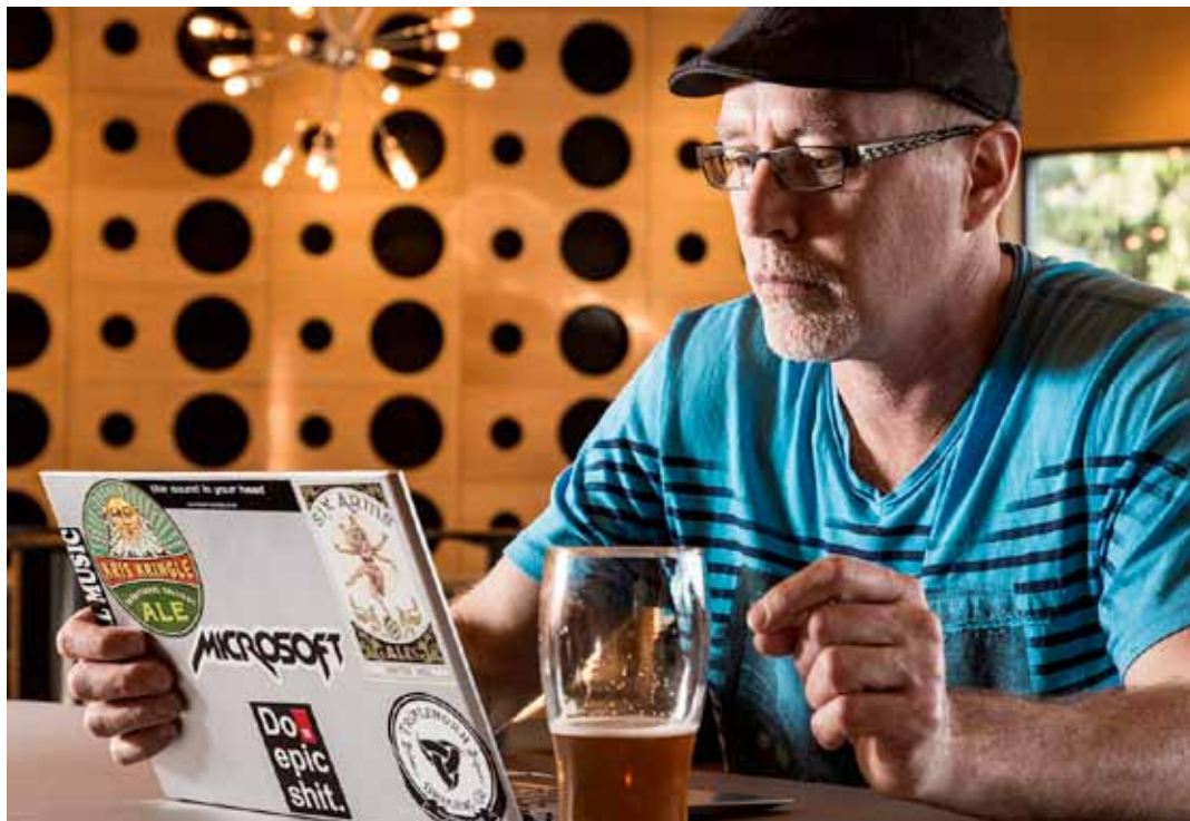
Učebnicový příklad tzv. PUB OFFICE

Každý - nebo alespoň drtivá většina - z vás zná pojem HOME OFFICE. Je to označení, které používají především pracující kancelářské krysy a volně přeloženo to znamená práce z domova. Novým trendem, který už se ve světě stačil uchytit a teď proniká i k nám, je ale tzv. PUB OFFICE.