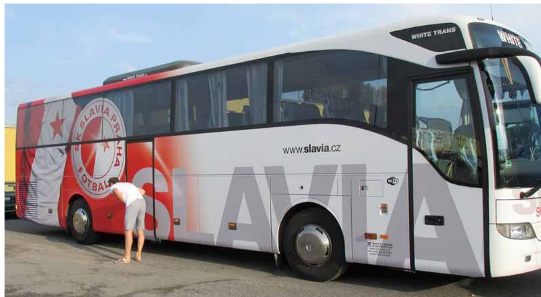
Lama u klubového autobusu pražské Slavie

Pražská Slavia Praha si svou ligovou generálku přijela odehrát na jih Čech. Konkrétně do Písku, kde se postavila buďovickému Dynamu a zvítězila 2:0.