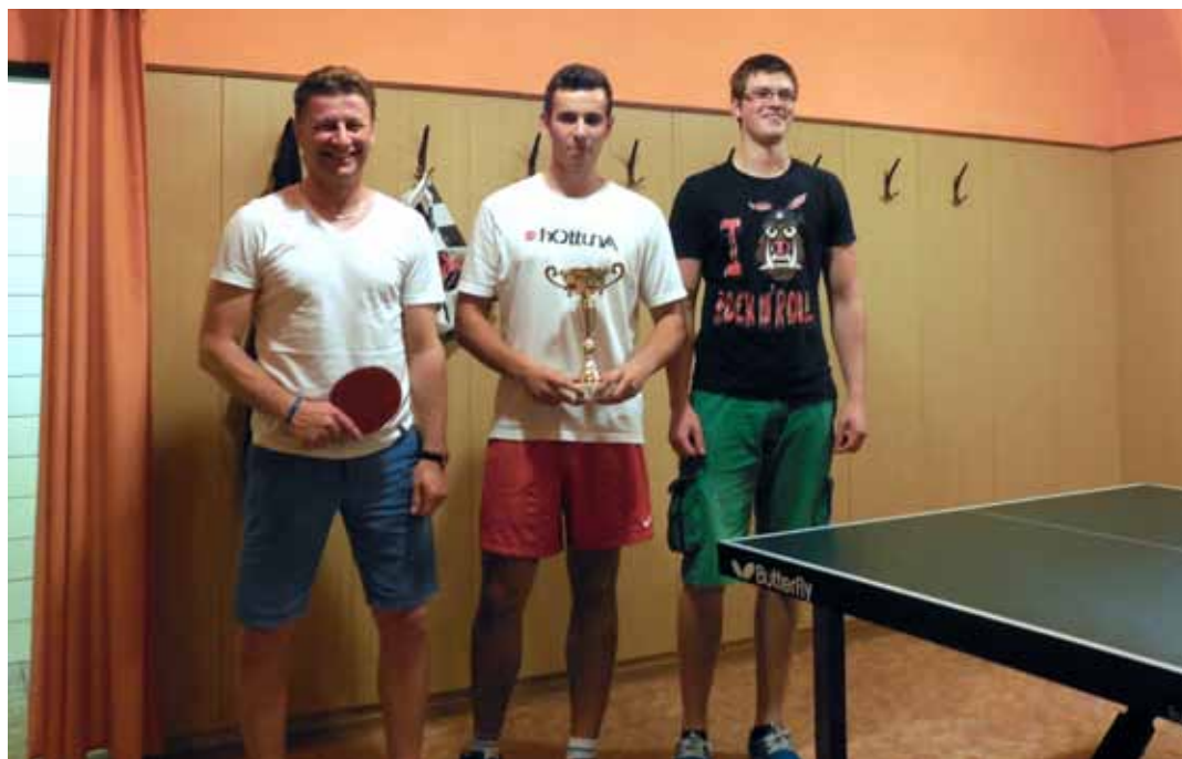
3 nejlepší plejeři premiérového ping pongového turnaje Pod Věží OPEN

V sobotu 13. září 2014 se u nás v hospodě uskutečnil historicky první ročník ping pongového turnaje Pod Věží OPEN, na jehož základě se nyní sestavuje žebříček PVTP (čti podvěží týpí ) - naše obdoba mužského tenisového žebříčku ATP.