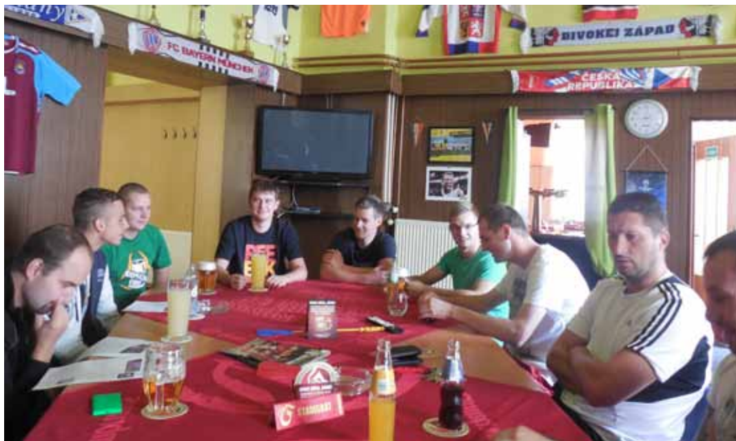
Zástupci jednotlivých klubů se sešli takřka v kompletní sestavě

V sobotu 23. srpna 2014 se u nás v salónku konala tradiční předsezónní schůze Vodňanské ligy.